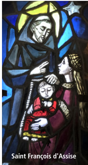
Saint François d'Assise

Saint François d'Assise a connu, lui aussi, la lourdeur du cœur à laquelle s'ajoute l'épreuve de la foi. Pour combattre cette passion, saint François d'Assise fera l'éloge de l'allégresse spirituelle : « Bienheureux ce religieux qui n'a de plaisir et d'allégresse que dans les très saintes paroles et œuvres du Seigneur et qui, par elles, conduit les hommes à l'amour de Dieu avec joie et allégresse. » 2