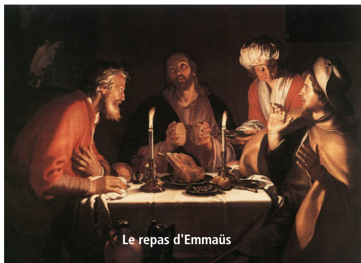
Le repas d'Emmaüs

À ce propos, j'aime retourner au chemin d'Emmaüs, à la pédagogie de Jésus qui s'y révèle, verset après verset. C'est l'antidote de la désespérance! À Pâques, nous célébrons cette victoire de la vie sur la mort : Christ est ressuscité. Il est vivant.