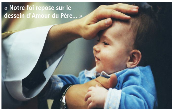
« Notre foi repose sur le dessein d'Amour du Père... »

Notre foi repose sur le dessein d'Amour du Père qui donne son Fils et son Esprit : Dieu a tellement aimé le monde qu'il a donné son Fils unique et cet Esprit, Dieu l'a répandu sur nous en abondance. Accueillons-nous vraiment le souffle de vie, ce souffle de tendresse, ce souffle d'espérance dans notre cœur?